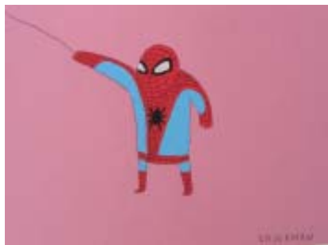
a sx Andrea Bertolini Le merde fanno affari 2 pastelli su cartone